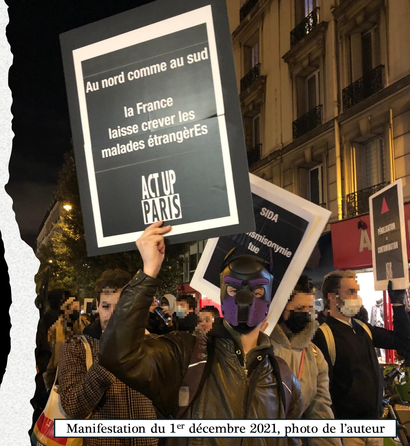
Manifestation du 1 er décembre 2021