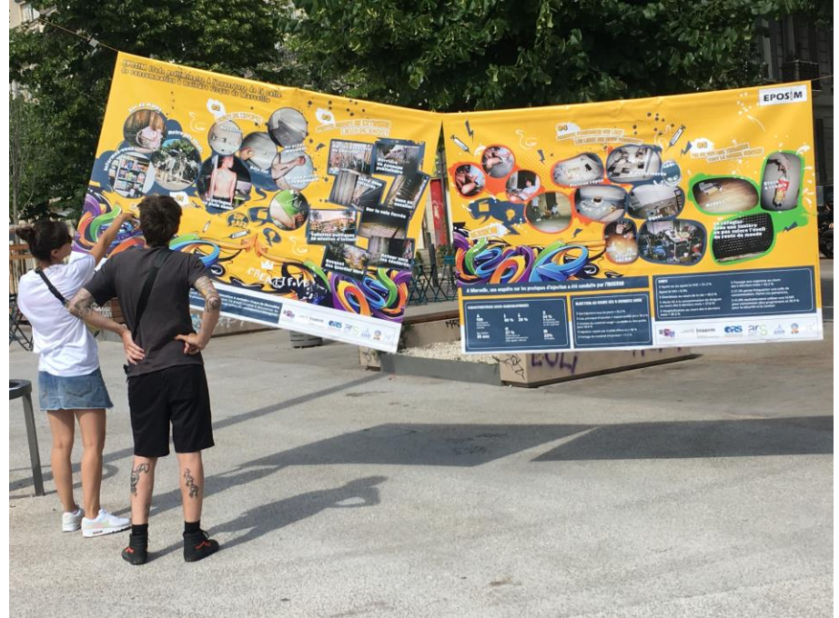
Exposition support don't punish 26.06.21