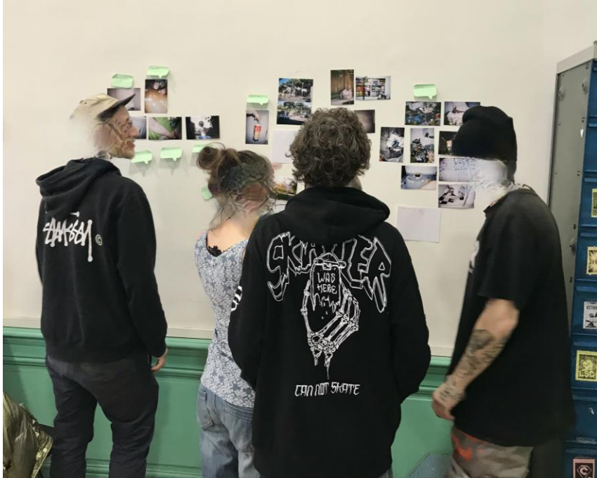
Atelier codage 2.02.21